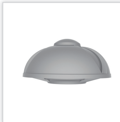
Wentylator dachowy Sztill(s)- (standard), Sztill(k)-(kwasoodporny). Typ: Sztills(k)-160, 250, 315, 400, 500. Obroty [obr./min-1 dwubiegowy]: 900, 1200. Wydajność [m 3 /h]: 252-1100. Moc [kW]: 0,04 k/1,25. Napięcie [V]: 1 x 230 lub 3 x 400. Cisnienie akustyczne [dB(A)-(1 m)]: 56-73. Wykonanie : laminat poliestrowo-szkłany. Kolor : dowolny wg tabeli RAL. Cena netto [zł]: 2270-13440.