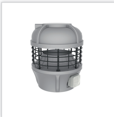
Hybrydowa, wywiewna nasada wentylacyjna MAG. Typ: MAG-200/AC lub EC dwubiegowy. Obroty [obr./min-1]: 1000/1400. Wydajność [m 3 /h]: 150-450. Moc [kW]: 12-70. Napięcie [V]: 1 x 230VAC 50-60 Hz. Cisnienie akustyczne [dB(A)-(1 m)]: 33/45. Wykonanie : laminat poliestrowo-szkłany. Kolor : dowolny wg tabeli RAL. Cena netto [zł]: 1860-2580.