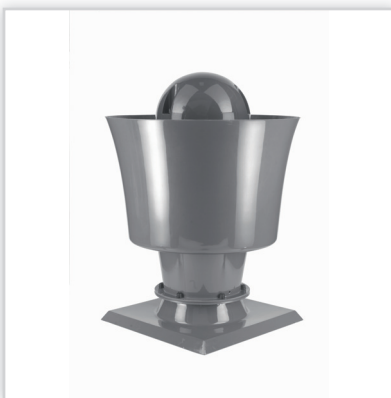
Wywiewnik WZs (standardowy), WZk (kwasoodporny). Typ: WZs(k)-315, 400, 630. Wykonanie : laminat poliestrowo-szkłany. Maksymalna temperatura [°C]: 700. Kolor : dowolny wg tabeli RAL. Cena netto [zł]: 1950-3900.