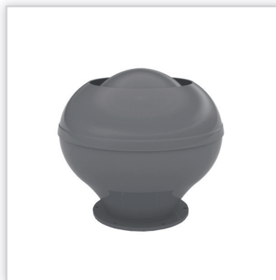
Wywiewnik WLO. Typ: WLO-160, 200, 250, 315, 400, 630, WLO PCV-160, 200, 250, 315. Wykonanie : laminat poliestrowo-szkłany. Maksymalna temperatura [°C]: 700. Kolor : dowolny wg tabeli RAL. Cena netto [zł]: 490-5870.