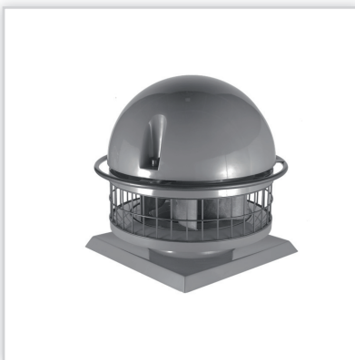
Wentylator dachowy DA (standard), DAK (kwasoodporny). Typ: DAs(k)160, 200, 250, 315, 400, 500, 630 DAs(k)-P2 i P3 (dwu- i trójbiegowy) 200, 250, 315. Obroty : 700, 900, 1400, 2800 obr./min-1. Wydajność [m 3 /h]: 200-36 000. Moc [kW]: 0,04/7,5. Napięcie [V]: 1 x 230 lub 3 x 400. Cisnienie akustyczne [dB(A)-(1 m)]: 51-89. Wykonanie : laminat poliestrowo-szkłany. Kolor : dowolny wg tabeli RAL. Cena netto [zł]: 1900-16 755.