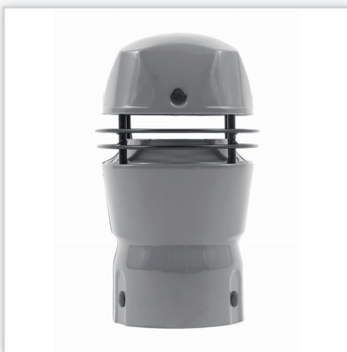
Hybrydowa, wywiewna nasada wentylacyjna FENKO. Typ: Fenko-150 z podstawą, Fenko-150 na PCV, Fenko- Schiedel 120/170, Fenko-150 Schiedel 170/120, Fenko-150Brass. Obroty [obr./min-1 dwubiegowy]: 1000/1400. Wydajność [m 3 /h]: 120/180. Moc [kW]: 6,2/9,5. Napięcie [V]: 1 x 230VAC 50-60 Hz. Cisnienie akustyczne [dB(A)-(1 m)]: 33/41. Wykonanie : laminat poliestrowo-szkłany. Kolor : dowolny wg tabeli RAL. Cena netto [zł]: 870-940.