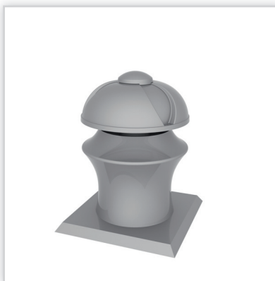
Wywiewnik Monsun. Typ: Monsun-315, 400, 630, 800. Wykonanie : laminat poliestrowo-szkłany. Maksymalna temperatura [°C]: 700. Kolor : dowolny wg tabeli RAL. Cena netto [zł]: 1450-4890.