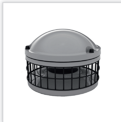
Wentylator dachowy FEN. Typ: FEN-160, 250, 315, 400, 500. Obroty [obr./min-1]: 700, 900. Wydajność [m 3 /h]: 325-7100. Moc [kW]: 0,04/1,6. Napięcie [V]: 1 x 230 lub 3 x 400. Cisnienie akustyczne [dB(A)-(1 m)]: 51-75. Wykonanie : laminat poliestrowo-szkłany. Kolor : dowolny wg tabeli RAL. Cena netto [zł]: 1860-8810.