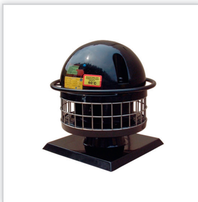
Wentylator przeciwwybuchowy DAExC. Typ: DAExC-160, 200, 250, 315, 400, 630. Obroty [obr./min-1]: 700, 900, 1400. Wydajność [m 3 /h]: 108-29 000. Moc [kW]: 0,06-5,5. Napięcie [V]: 3 x 400. Cisnienie akustyczne [dB(A)-(1 m)]: 49-81. Wykonanie : kompozycja antystatyczna. Kolor : czarny. Cena netto [zł]: 3025-33 120.